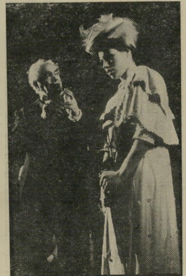
בתיאטרון ופינקל "משיח החלומות" לא קל להיות אדם

כל מי שחשב עד היום כי השחקן הוא האיש החשוב בתיאטרון, שכח לקחת ב-חשבון את נוכחותו של הבמאי מייק אלי פרדס, (איש התיאטרון של העולם הזה לתשל"ב) כי אצל אלפרדס, שחקנים (וגם מחזה) אינם אלא כלי שרת להצגת תר-גיליו הווירטואוזיים השונים על הבימה, לכן, החמורים (התיאטרון העירוני,