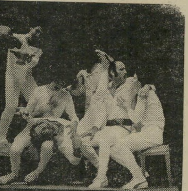
החמורים קשה להיות חמור

עוות כימעט כמו בקירקס, ולתקוע בתי דירות גבוהה למדי בדיחות גסות פחות או יותר, המכוונות כולן אל מתחת להגורה. משום כך, מחצית השעה הראשונה היא משעשעת למדי. אבל אחר כך, כשהעין מתרגלת לכל התעלולים, הקפיצות והני-תורים הבלתי-פוסקים, האווזן רוצה ל-התחיל לקלוט משהו מן הנאמר על הר בימה, והמה מנסה להבין את הטעם ש-בכל זה. מסתבר שהמלך הוא עירום. מעשיותיו של פלאוטוס על צעירים אויליים המאוהבים מעל לראשם, זקנים תאוותנים, זונות רודפות-בצע ומשרתים ערמוניים, שרתו את שקספיר או את