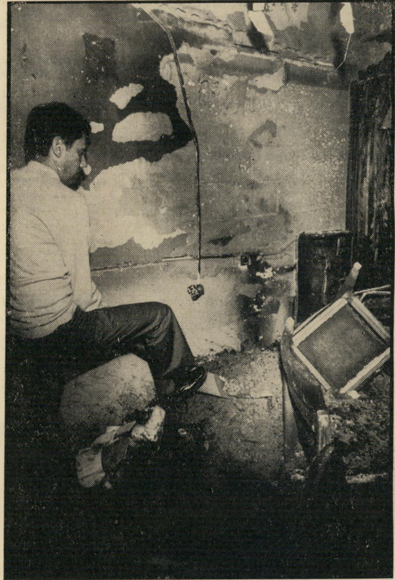
כתב מרסל זוהר חוזר לשולחן עבודתו עם עשן

מה גם שאין זה הפשע הראשון כלפי העולם הזה - ובכל המיקרים הקודמים לא נתגלו הפושעים. בסוף 1952 הונחה פצצה במער-כת. היא התפוצצה ופצעה את דוש (קרי-י)