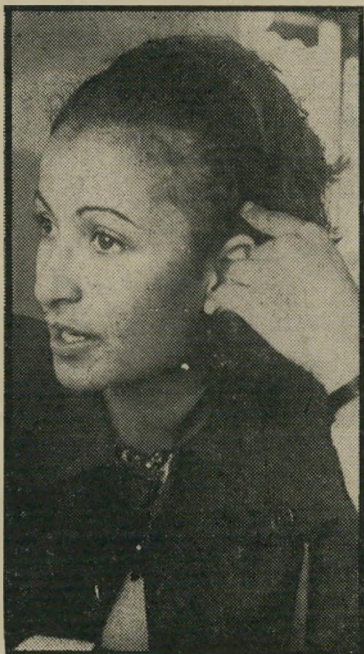
עצירה ציטרומ צדק, לא פשרה

רציתי אהבה. על האירוע הנורא בי יותר כחיה מספרת חדוה: „הייתי בי־שיקום במוסד בנ־ציונה. כשחזרתי ה־ביתה, שאלה אותי אמי: „בשביל מה חזרת בכלל? תגובתי: חתכתי את ה־