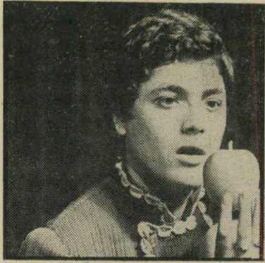
שזחא ארצי לא משורר גדול

לרצון הטוב ולכנות של ארצי, תקליטו לוקה בכינוניות מונוטוניות, ובנושאים פרי טיים שאינם מצליחים למשוך תשומת-לב, אולי משום שארצי אינו בדיוק משורר גדול. הנושא של השיר דנה מזכיר, להבדיל, את סוזאן של ליאונרד כהן. נוף ילדות אינו שונה מכל תיאור ילדות קשה או