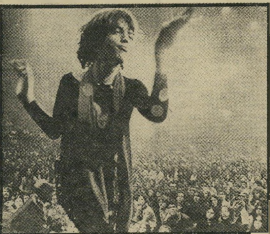
ג'אגר: תהום בין אבנים מתגלגלות

מכון, מצולם בתיכונן ודיוק רב על-ידי צוות טכני משובה. כסרט, "תנו לי מחסה" מעיף את העיניים, מאחר וצולם ב-16 מ"מ והוגדל אחר כך, ומכיל קטעי-מילואים, במטרה (ואולי מן הסיבה שכל הדור הזה חולה אלימות) ש-לף אקדה. כתעודון מציג הסרט הספר סופי לפסטיבלי הרוק למי-ניהם (התפרצויות דומות קרו בפסטיבלים נוספים לאחר לספק למעריצי מיק ג'אגר הזדמנות לחזות בהתפתלויותיו.