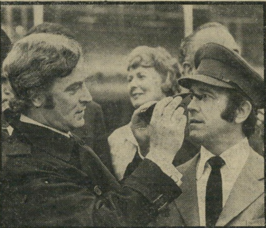
הנדרי וקין: מוות בין ביריונים וזונות

האומר שרוצח-בשכר יכול להיות אנושי, והוא בכל מיקרה עדיף על העלוקות המפעילים אותו, או על מלשינים ומר-גילב למיניהם.