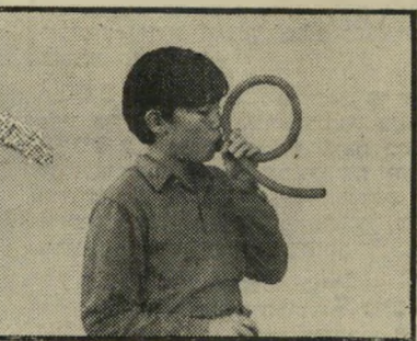
הצינור השורק - אפשר לנשוף

יושב לו יום אחד יצרן פלסטיק נודע במשרדו ולוכה על חשבון מס ההכנסה האחרון, כשלתע מסכה דבר מה גדול את עין השמש. כשמתבהר קצת, מוצא היצרן