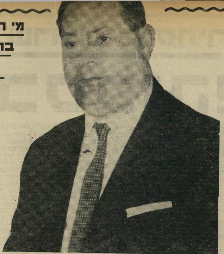
אירי-מכוניות שובינסקי מדוע הוא נותן?

שביגי ישלם עבור המכונית 10 ל"י. שמעה פולה בן-גוריון את ההצעה וקפצה מיד: „אם כך, קח 20 לירות ותן שתיים.“ כפי שהסתבר מהמידע שהגיע למשטרה לא כללו טובות ההנאה רק מכוניות ב" תנאים נוחים. כך, בין השאר, קיים חשד שמספר פקידים בכירים כילו חופשות של בתי-מלון מפוארים בארץ על חשבונו של שובינסקי, סוחר הלקרדה מרחוב הגשר שהפך תוך שנים מועטות לאילי-המכוניות של ישראל. אישים אחרים, שלא היו מר-כנים להסתפק במכוניות העממיות של טריומף, זכו לקבל באמצעות שובינסקי ומפעליו מכוניות מפוארות יותר, מיגואר ועד ב.מ.וו.