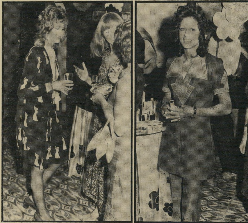
דיירת יופי שז' מרי קוואנט ויועצת פאט מאש בתצוגה סכנות ליפיים

כאשר הגיעו משרד-התחבורה וחברת האוטובוסים דן לידי הסכם באילו מה-קווים העירוניים בתל-אביב יעלו מחירי הנסיעה ב-20% ובאלו יעלו המחירים ב-40%. היו להם חישובים, השומרים בסוד. דובר משרד-התחבורה מחזיק עד היום בדעתו כי שיעור ההעלאה הכללית במחירי