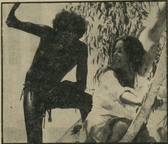
אגוטר וגומפיליל: חזרה לעצים

הרבה דברים אינם קורים במשך כל הסרט הזה. זהו בעיקר סרטו של צלם, (הבמאי ניקולאס ריי היה בעבר צלם מהולל, שעבד עם לוסיו וטריופ) המנציח את אלפי הפנים של הערבה האוסטרלית, ותוך כדי כך עורך הש-יוואות אינסופיות בין החיים בחיק הטבע, עם הפרמיטי-טיביות שבהם, לבין הקירות האטומים והמחניקים של העיר הגדולה. הסרט מלא וגדוש רמוזים מנייים, שהם הרי חלק בלתי-נפרד מן הטבע, ויש בו כמה התקפות חזיתיות על האדם המודרני, למשל בדמות רוצחי חיות