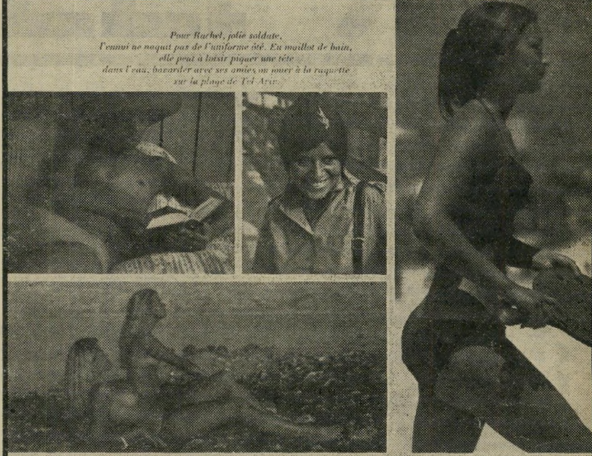
Pour Rachel, jolie soldate, l'ennemi ne noquit pas de l'uniforme dit. En maillot de bain, elle peut à loisir piquer une tête dans l'eau, bavarder avec ses amis ou jouer à la raquette sur la plage de Tel-Aviv.

צריך רק לציין שבעוד שכלל השמות ניתן כיוסי, הרי רק לשם אחד אין מלווה אף תמונה בכתבה — שמה של גולדה.