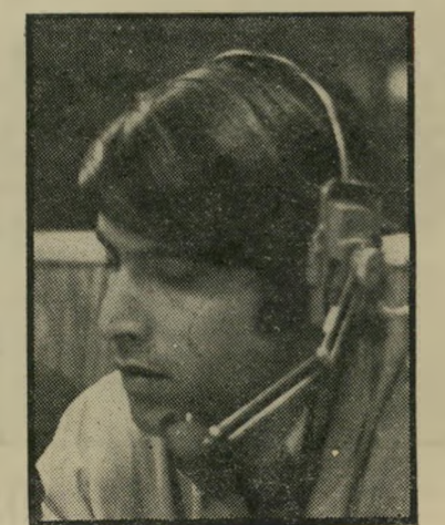
במאי מיועד גרון - יש חדש בחדשות

"יש מרחב פרישה". בתשובה על השאלה הפרובוקטיבית: "מה דעתך על הטלוויזיה כיום, בתור צופה? ענה תדמור: "אני חושב שהטלוויזיה די טובה. אבל יש מה לשפר. מה אתה רוצה שאי גיד, שהיא גרועה?!" על היחסים עם העובדים דיבר תדמור בדחילו ורחימו: "עד עכשיו נתקלתי ביחס אהוד מצד כל הדרגים. אם זה מה שיקרה ב-15 לאוקטובר? (זמן כניסתו הרשמית לתפקיד) כודאי שלא. או צריך לקבל הכרעות. אני מודע לעובדה, שהעובדים בתחום היצירתי הם בדרך כלל אישיים מיוחדות במינם. זה לא אומר שכולם מקוריים מאד. ברור לי שקיים עימות בין הקאפריזות החיוביות שלהם לבין המינהל. זוהי דילמה. אבל יש מרחב פרישה". דבר אחד מבקש תדמור: למדוד את הצלחתו או את אי הצלחתו לפי מה שיעשה בטלוויזיה ולא לפי נסיבותיו הרקודמים בחייו. אולי זה מה שנחוצ לטלוויזיה כיום — מנהל שהוא צופה.