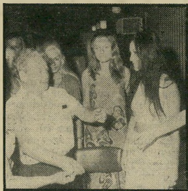
מגישה עם ראשיהעיר צחר

בחוף כינרת, ביום שלישי 5.10.71 בשעה 8.30 בערב