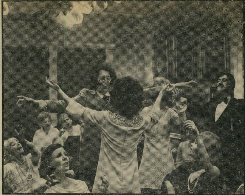
3. התפשטות (ארה"ב)