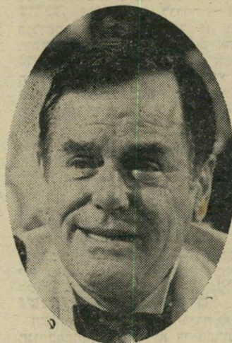
שחקן מי שנה השנה גיג יאנג "הם יורים גם בסוסים"

אי-שביעות-הרצון מן המיסטר הדמוקרטי, ובעיקר מן המשטרה הדמוקרטית, ודרכיה האלימות המעוותות את הדמוקרטיה ל"צרכיה הפרטיים.