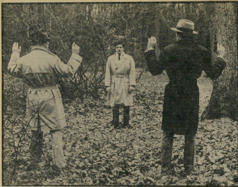
4. המעגל האדום (צרפת)