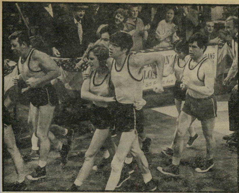
2. הם יורים גם בסוסים (ארה"ב)