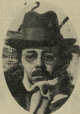
שחקן השנה דירק בוגארד "מוות בוונציה"

איך אפשר לסכם את שנת תשל"א בקולנוע? זה עניין של טעם. הכל תלוי במי שמסכם.