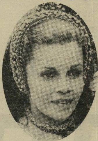
שחקנית השנה ג'נבייב בוז'ולד "אן של 1000 הימים"

נטייה נוספת, שהלכה והתגברה בסרטים מכל קצוות תבל (פרט לישראלים) היתה