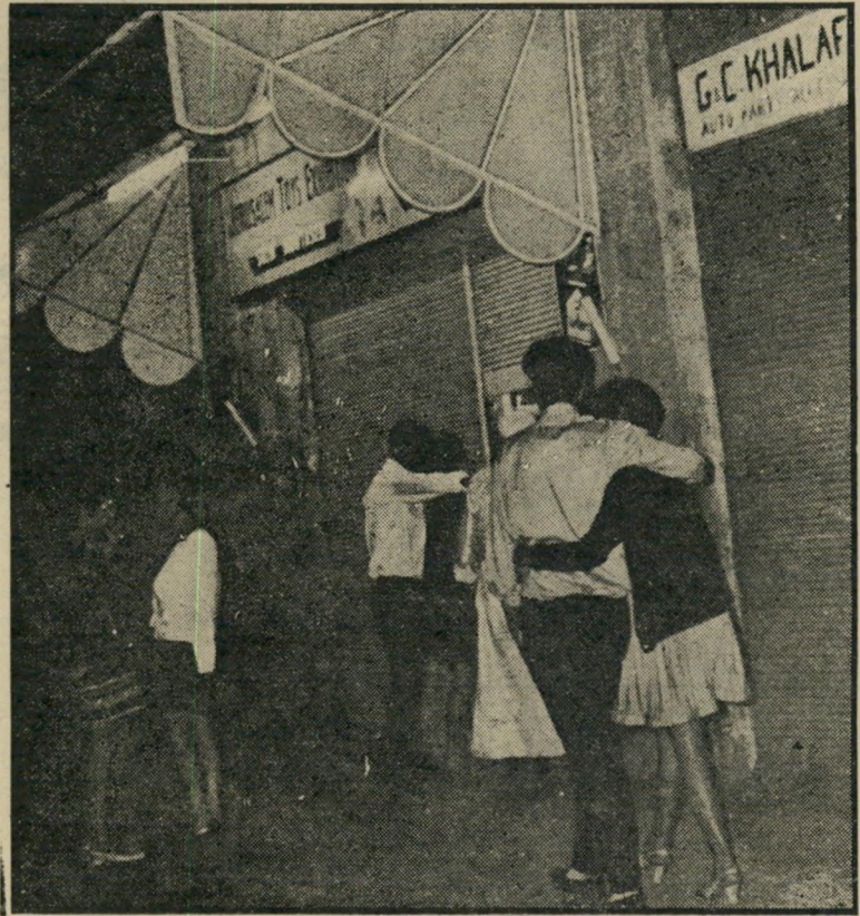
פרוצות בעיר העתיקה