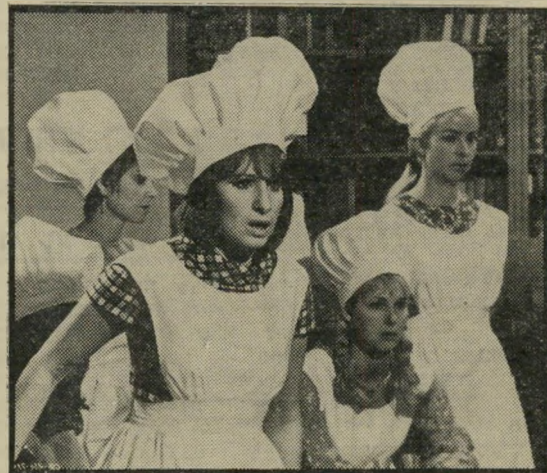
סטרייסנד תמיד סטרייסנד: עד מתי?

מי יכול להכיר בכל זה את וינסנטה מינלי, מ"אמרי-קאי בפריס"? רק מי ששיש לבו לתפאורות, לאסטטיקה של צילומים, או לסצינות בודדות, כמו זו בה קורא הפרו-פסור מונטאן למדיום-ברברה לשוב אליו, וקולו בוקע מפי