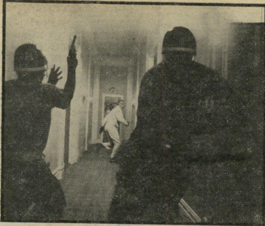
סי-איי-איי, אפי-בי-איי - איי-איי-איי!

ומרוב עצים, אין רואים את היער. חלק נכבד מכל