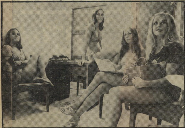
מועמדות לכתר מלכת המים במערכת

מהשער הקדמי — לאחורי, הצוות האחראי לכתבת איש השנה, איננו היחידי הנמצא במתח הולך וגובר, ככל שקרב