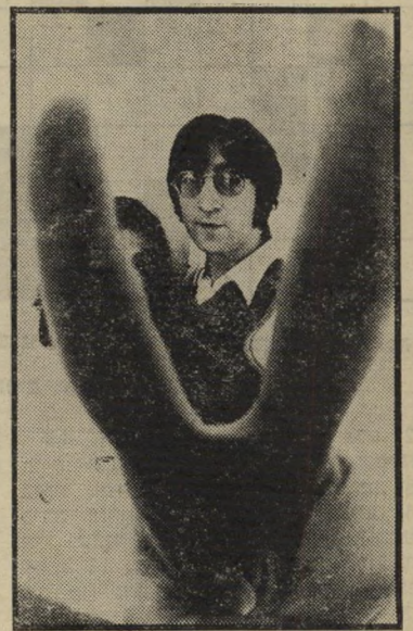
צילום מעונן של ג'ון ולנון

וכך, בהשפעת העוגיות, ביצעתי את הצילומים. כשיצאתי, שאלתי את המשרת היפאנית החמודה ממה העוגיות היו עשויות? "מאפה-בית", השיבה בפרצוף יפאני תמים.