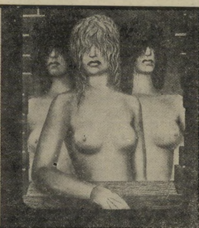
היומן לתלמידי תיכון סמים ומישגל בכיתה