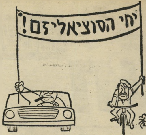
פועלים ובירוקרטים בעיני הצייר

בסוף תשל"א, היתה זאת תקווה. היה דרוש אופטימיזם רב כדי להחזיק בה נוכח המצי-אות — כימעט כמו האופטימיזם שחולק, לפני שני דורות, את המהפכה הגדולה שייצרה בארץ זו יש מאין.