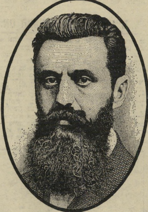
זקן א': תיאודור הרצל

י תכן שמצבה של ההסתדרות היה שונה מומן, אילו היה קיים בארץ מאבק-מעמדות מן הסוג הרגיל — עובדים נגד מעבידים, עבודה נגן הון. אולם בישראל מאבק זה הוא מישני, בעל חשיבות מעטה. כימעט כל השביתות שפרצו בתשל"א היו נגד הממשלה. המעבידים הפרטיים העדיפו להסתדר עם עובדיהם, ולמצוא פיצוי עליוני העלאת מחירים או קבלת תמיכה ממשלתית. גם מצב זה הוא תוצאה הגיונית מן העבר הציוני. כי הודות לאופי הציוני של המדינה, זורם אליה זרם בלתי פוסק של הון זר — תרומות של יהודי העולם, מענקים של ממשלת ארצות-הברית (שמנהיגיה צריכים להתחשב בקבוצת-הילחץ היהודית בארצם), שילומים ופיצויים מגרמניה — נוסף על הרכוש הערבי הנטוש שנפל בידי המדינה במלחמת העצמאות, ואוצרות הטבע שנכבשו במלחמת ששת-הימים. כימעט כל הכסף הזה אינו בא תמורת משהו, אינו קשור בתנאים. זרם בלתי-פוסק זה שז החון מבחוזי מטי ביט את חותמו על כל החברה הישראלית.