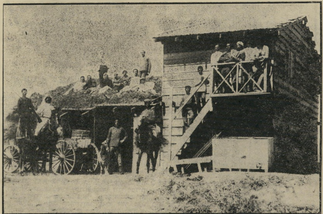
ההתחלה: התצלום המפורסם של ראשוני דגניה *

ל מראית עין, ישראל היא ארץ חלומותיו של סוציאליסט דיוקרה. כל תייר זר, העובר בארץ בטויל מודרך, רואה זאת.