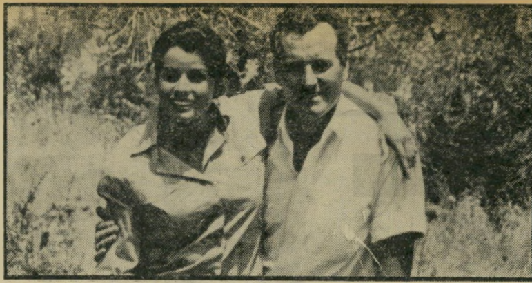
המאירי וכוכבת סנטה ברנר

רק אבא מטורף מעדיף לשמוע שבתו נהרגה, ולא מוכן לשמוע על השתתפות