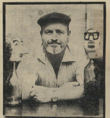
ירי מנוסי והבובות סטריילי, אבל מעובד

טלוויזיה שאינה מרשה לעצמה להציג ולהשמיע דעות ביקורתיות על השלטון ו' מוסדותיו, אינה יכולה להרשות לעצמה