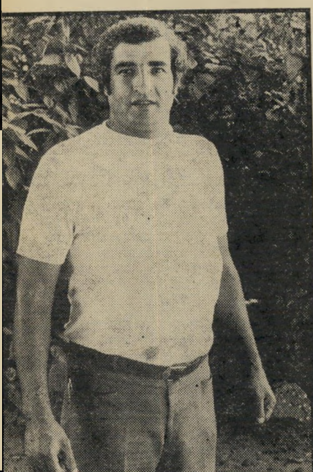
פקח דנון אדם רגיל

סומי המשטרה ומינהל מקרקעי ישראל, כאילו ניתן לה אישור מפורט על המטמון שנמצא והוחרם בידי מינהל המקרקעי. הרי האישור הרשמי היחיד הנמצא בידי צוריה היא הזמנה מהמשטרה לחקירה.