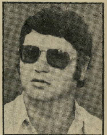
אופנוען אלי 40 מ' ארץ —