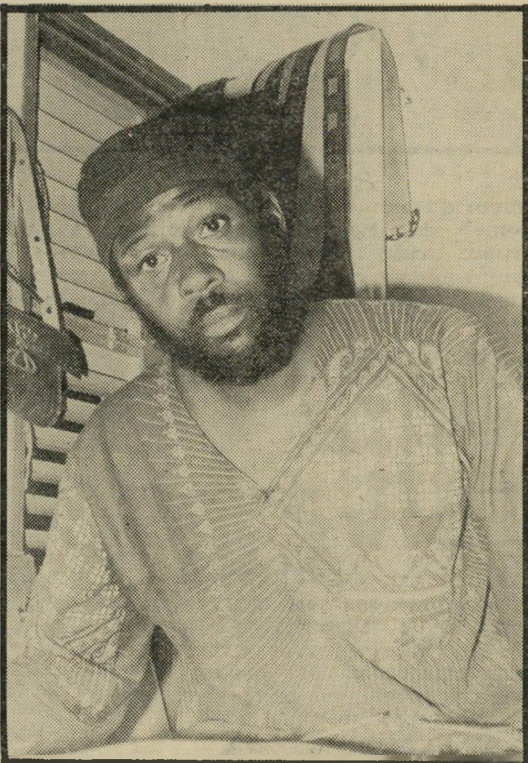
בִּיְעָמִי קרטֶר, המנהיג, נשוי פלוס ארבעה, שילוב של דמות מנהיג ונביא: „באנו לחיות כאן בשלום — וכופים עלינו לצאת למלחמה.“