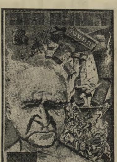
איש השנה תשכ"ה מפגל מפאי בג'וריון