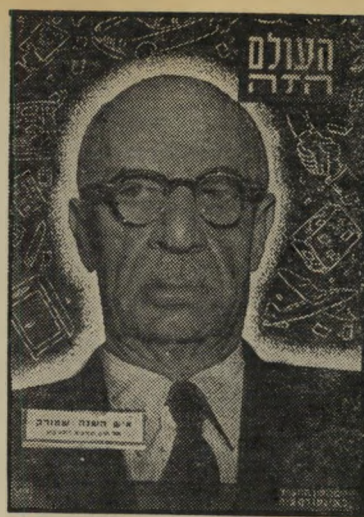
איש השנה תש"ב מבקר הסוכנות שמוראק