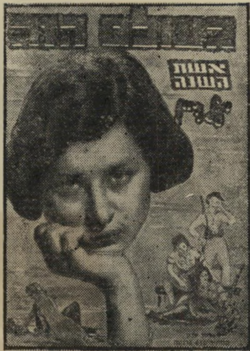
איש השנה תש"ט סופרת דיין