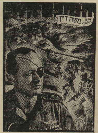
איש השנה תש"ז מצביא סיני דיין