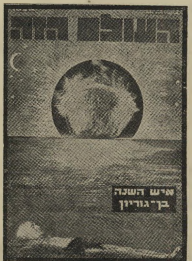
איש השנה תשכ"ה מתפטר בג'וריון