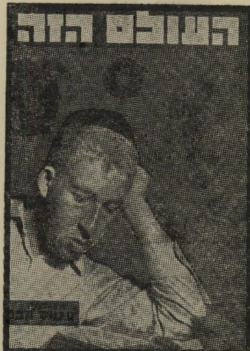
איש השנה תש"ח חתן תנ"ך חכם