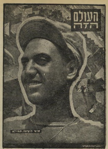
איש השנה תש"א העולה החדש