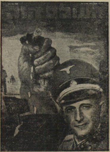
איש השנה תש"ך רכז שואה אייכמן