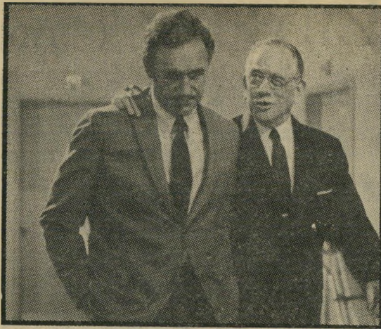
דאגלס והאקמן: משפחה מתוסכלת

בה נחשב כמעט לאלמוני, לפני החיים המתוקים ושמונה וחצי. כמובן שמאו עברו שנים רבות, בכמן הפך ממבקר לבמאי סרטים דוקומנטריים, ופליגי, כנראה מתוך הכרת תודה על הש- נים הנה, הסכים להרשות לו ולצוות במאי טלוויזיה להסתובב על בימת הצילום של טאטריקו, ולאסוף רשמים לקראת תכנית דוקומנטרית שהתכנן בכמן לעשות. ואכן, התוצאות של יוזמה זו הן בלתי שגרתיות בדיוק כמו הנושא. התוכנית,