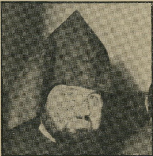
בישוף אג'אמיאן רק נישואין בסתר

לאחר שלוש שנים של רומן סוער, החליטו הבישוף והדיילת, בתום ביקור קסום בהונג'קונג, להינשא. אמנם אקט זה אסור על אנשי הכנסייה הארמנית, אך הבישוף ביקש לעקוף את האיסור עליידי נישואין אזרחיים בלאס