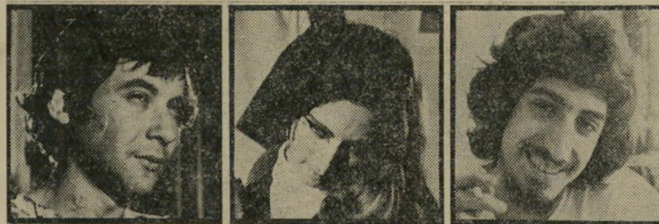
ממציאים דוי, מוקדי, עין-דור שיחה מקריית -