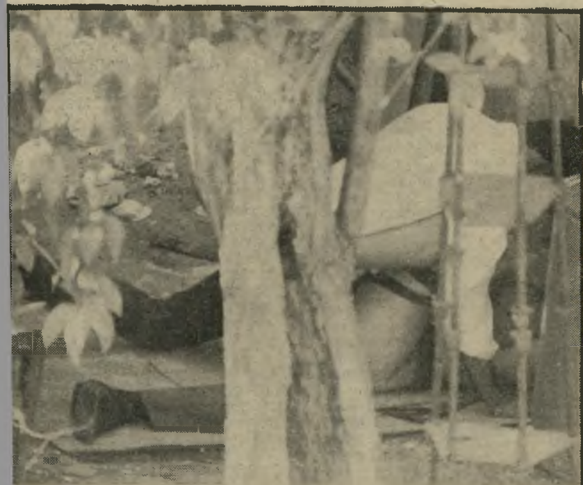
מישגל הלקוח והפרוצה במישגל, על ריצפת החצר הרחבה שאינה מוסתרת כלל מהמידרכה. הפס השחור על ירכה של הפרוצה — שולי מכנסי השורטס שלה, אותם אין היא טורחת להסיר מעליה, אלא רק להפשילם.