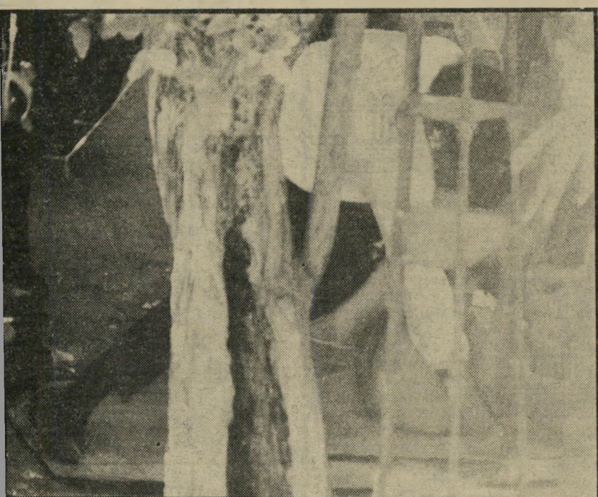
שלב א' התמונות בעמוד זה צולמו לאור היום, מתוך כניסה לאחד הבתים ברחוב לבונטין: הלקוח כורע לעבר פרוצה השוכבת על הקרקע.