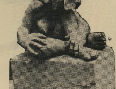
היצירה הפסל, "נערת הפרחים" מדגים את הסיגנון מלא העוצמה של אילנה גור.

המשך - שנתגלה ככל שהת' קרבה הנהגת הוזהרת אל מרכז הבור' המה - תאם בהחלט את ההתחלה: שני זוגות ריסים מלאכותיים באורך שני