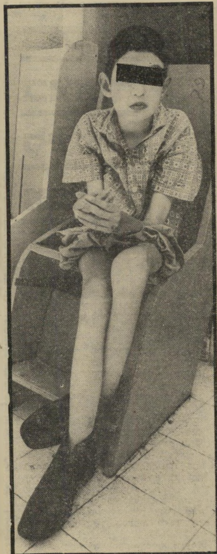
רזון מבעית כרוב חולי ומורסד, גם ילד זה סובל מרזון מפחיד. מהי הסיבה?

(המשך מעמוד 9) בוכים, מייבבים, זועקים. אחרים — קפואים, יושבים או שוכבים. בהים לחלל באדישות מבהילה. בכל החדר אין סימן לצצוע. למשהו העשוי לבדור ילד, להקל עליו את שעות יומו השוממות, האינ-סופיות. עלמה מפוקפקת א היה זה מיבצע פשוט, לחדור לבין כותלי בית פנחס. מדרוה זהר על פנישתו הראשונה עם המקום, ועל מאמציו עד שזוכה להיכנס לביקור שתואר לעיל: בית פנחס נמצא כמאתיים מטר מהכ"ביש, אך את הצעקות אפשר לשמוע כבר מהכביש. גדר תיל דוקרני נועד להרתיע מבקרים לא מוזמנים. שער ברזל כבד, שרשראות ומנעולים. אנו מתגברים על המכשולים, אך גער צרים בטרם הגענו לבניין המרכזי, הדור קומתי, עליי קבוצת בנות. אלה, מס' תבר, אחדות מה"מטפלות". אחדות מהן — בנות 15-16. "לא לצלם", זועקת המ"ר היגה, צעירה שמנה בשנות העשרים שלה, בעלת פרצוף מוכר לי מאיזה מקום. "אני אשבור לכם את המצלמה. מה תעשו לי? תוכלו לנשק לי". ודאי. נזכרתי. בפעם האחרונה שפגשתי בעל-מתחן זה, הייתה מארחת במקום-בידור