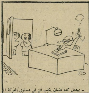
— يعمل كده عثمان يكتب فن في مستوى المعركة !!

מוות. בין מאה הנאשמים, הפעם, נמ- צאים מישל עפקל, מייסד מפלגת הבעת. אמין אל-חאפז, נשיא סוריה לשעבר. שבלי