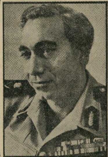
נידון האפז היורשים שפטו למוות

בגילויי־הדעת הסנסציוני, קוראים הנכרי בדים ל"יתר הבנה לחינותם של האירי גונים הפלסטינאים" תובעים מחוסיין לקבל