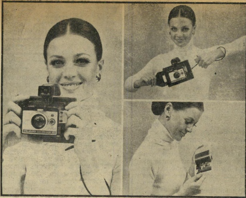
רוגמנית יצחקוב בהדגמת מצלמות פורטמט ברחבי העולם

נוגדות על אותו מאורע, זו של הערבים וזו של ישראל, היה זה ברור לכל למי נושה העתונות העולמית להאמין.