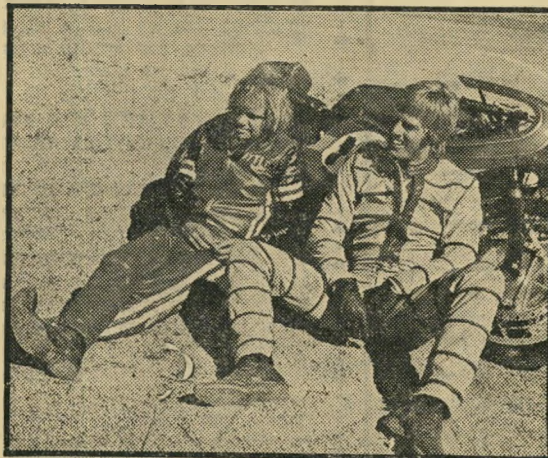
האלטי ופאוס: צוענים על אופנועים

האלטי הוא גבוה, רחב-כתפיים, יפה תואר, רברבן וביטוח בעצמו. הוא מפצה את עצמו בדמיונות-שווא, על כל מה שאינו משיג בחיים. פאוס הוא קטן, מכוער, ביישן ועקשן, והעולם, בסופו של דבר, שייך לפאוס ולא להאלטי. סידיני ("תיק איפקרס") פוירי, הבמאי הקנדי שעשה קאריירה באנגליה ונחטף על-ידי הוליווד, מגיש סרט זה בצורה מוזרה למדי. מאחר ורובו מתרחש במדינות הדרום בארצות-הברית, על מסלולי מירוץ עופשים ומאובקים, נוצרת גם אווירה בהתאם. אווירה של בטלה איטית, מהורררת, כמינהג אנשים תחת שמש לוהטת. הטיפוסים של