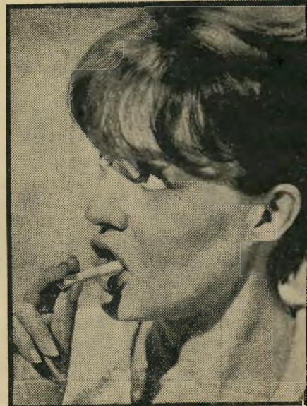
מפיקה ז'אן מורו יפת, אך לא טיפשה

האיטלקים, המכירים כבר את הבעיה מתקרות דומות בעבר, הציעו לשלם ל-מוחים שכר יום-עבודה, ולשלוח אותם הביתה. האמריקאים, המנוסים עוד יותר בצרות מסוג זה, שכרו רק את מנהיגי הניצבים, החביאו אותם איש-על-בימת-הצילומים, כדי שלא יפריעו, ואילו המומן, ללא מנהיג, הלך הביתה.