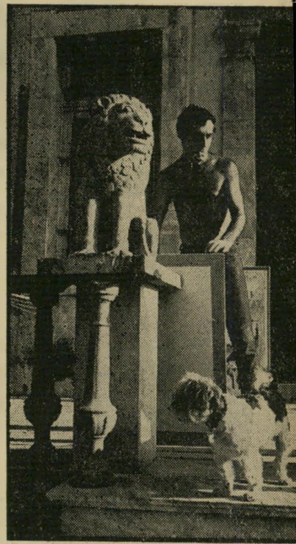
צייר בוכבינדר, אריה וכלב

ברגע של תיקווה גדולה האמין שיוכל לצייר גם בקיבוץ. אבל זה אפשר רק אחי-רי העבודה. ולמי יש כוח? אחרי חמש