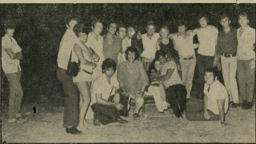
הפצועים החוגגים על החוף — לאירוטין על שפת-הים

דורי היה אחד האורחים הבודדים ש' באו בכוחות עצמם. כל האחרים נאספו באוטובוס מיוחד מבית-החולים הדסה ב' ירושלים, תל-השומר, ואחרים, והובאו