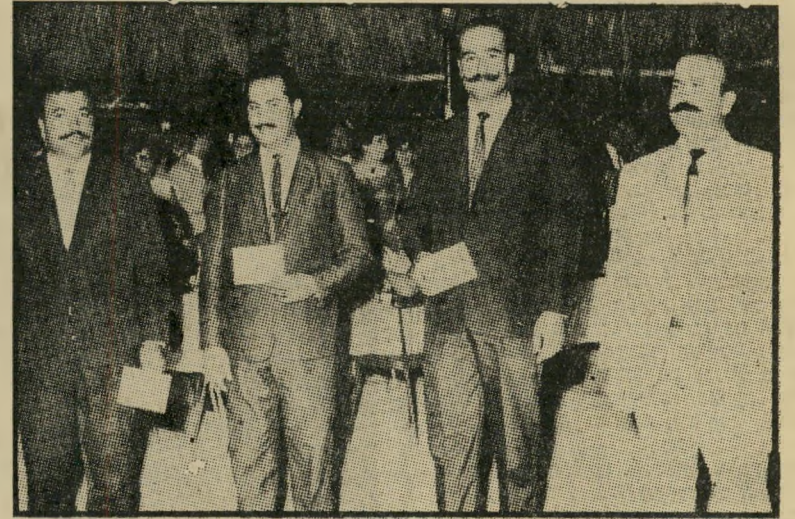
הזוכים בתחרות השפם היפה * הופעה גברית

לא רק מדינת ישראל נאבקה קשה לשמור על כל דולר הנכנס לקופתה. גם מצריים כנ"ל. עם תחילת עונת החופי- שות, לאחרונה, פנה משרד התיירות המצרי, במסע-הסברה, שנועד לשכנע את המצרים המתכוננים לנסוע לטיול בחו"ל — לעשות זאת במצריים עצמה, לחסוך בכך את הוצאת המטבע הזר. אם להאמין לדובר המשרד, הרי שמש- רד התיירות הישראלי יכול רק להתקנא בו: „המיבצע הצליח,“ קבע הדובר הש- בוע. „כמיליון תיירים — בחלקם הגדול מצריים — התארחו עד עתה באלכסנד- ריה, ואנו מצפים לרבע מיליון נוסף עד סוף העונה.“