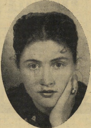
תאומת-עזה הזן — התגרשת ממנה

השירותים, לדירה, משותפים לשבע דיירי נוספות, המקיפות אותה חצר, כאר-