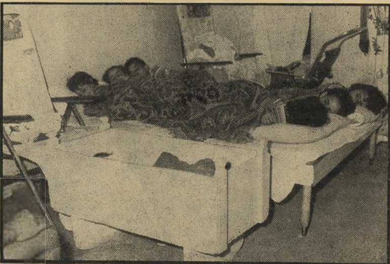
ירדי אסלסקי במיטה ובארגז רוצה תוצאות? לך תשובות

רק אז, זכה להתעניינות מצד המדינה. בתמורה להסכמתו לסיים את השביתה המביכה, קיבל הבטחה להחלפת הדירה.