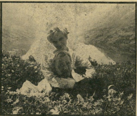
גריג: שמאלץ אמריקאי בהרי נורווגיה

בקיצור, אוהבי המוסיקה של גריג לא ירוו כאן הרבה נחת, ולעומתם, גם הרוצים לעמוד על חוויות המלחין ובני תקופתו במאה שעברה, גם הם לא ימצאו את מבור קשם. היחידים העלולים ליהנות אלה הם אוהבי הסרטים המוסיקליים המתקתקים, המחפשים לחנים נעימים לאוזן.