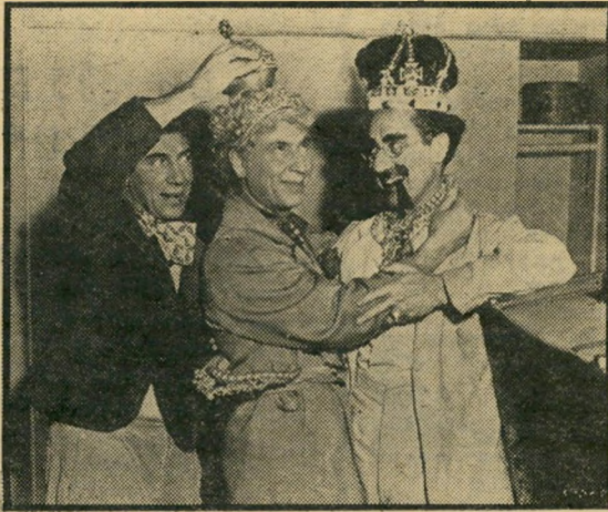
גרושו, הארפו וצ'יקו: אוצר

אמנם, רבות מן החוכמות המילוליות של גרושו הולכות היום לאיבוד, היפהפיות מצחיקות יותר מאשר מסוכנות, ואפילו חלק מן התעלולים החזותיים נראה מאולץ. ובכל זאת, אפילו על-ימנת לראות את צ'יקו מנגן בפסנתר או את חסיום המופלא, בו מחבלים השלושה בנסיון הבריחה של הנאצים, כדאי לראות את הסרט.