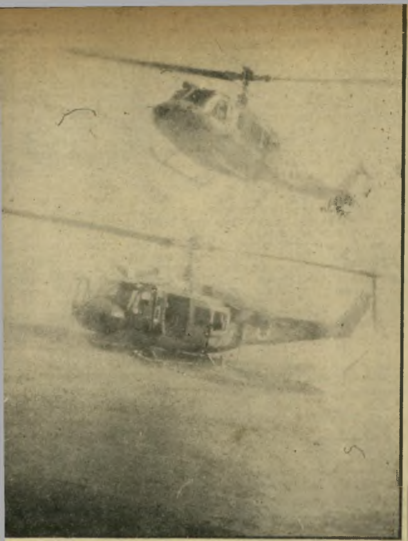
1 דקה אחרי נחיתת האונס. תמונה זו צולמה בידי אחד החיילים שהוטסו במסוק מדגם בל בשעת מירוף אחרי חבלנים בערבה, אחרי שהמסוק נפל על הקרקע כתוצאה מקילקול במנוע. הנפילה היתה מגובה של כ-300 מטר. המסוק ניזוק, אבל החיילים והצוות לא נפגעו. מיד אחרי נחיתת האונס החל לרחף מעליו לחיפוי המסוק השני מדגם בל שהשתתף במירוף. אי-הבהירות בתמונה נגרמה על-ידי ענני אבק עצומים שהקימו כנפי המסוק המרחף מעל.

* תקנה 7 (2) אוסרת על עורכי-דין לפרסם את מקום משרדו שלא בשלט או בכרטיס-ביקור או בנייר-מכתבים רשמי; תקנה זו אוסרת גם על ייזום פרסומת עצמית או תחזות בלתי הוגנת. תקנה 16 מפרטת שורת פעולות פירוטומת אסורות.