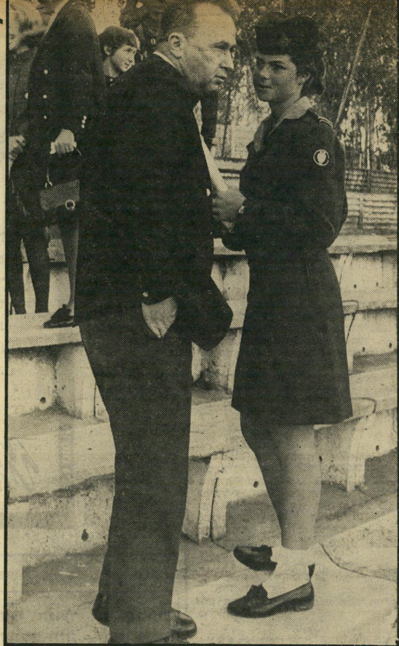
רבין ונתו בישראל הוא נדפך

מצד אחד: השאיפה למדינה יהודית ייחודית והומוגנית, ללא אוכלוסיה זרה. מצד שני: הדחף הנחלני, שהשתוקק להתפשטות על פני השטח, בארץ-ישראל