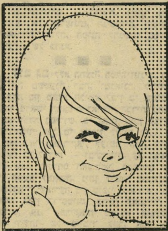
סטודנטית עבדי-אימוניעים בן-גוריון — יסוד להצלחה

היה זה רעיונו של נאצר, לגייס את אלפי הסטודנטים הלומדים בחו"ל למאמץ ההסב-רה המצרי ברחבי העולם. בעקבות כך, הוד-מין ב-1966, משרד ההסברה המצרי כמה מאות סטודנטים כאלה לביקור במצריים בי-עת חופשתם. הוכן עבורם קורס הסברה על-הבעיות המדיניות באזור. נאצר היה הי-גואם הראשון בקורס, הסביר לצעירים עד