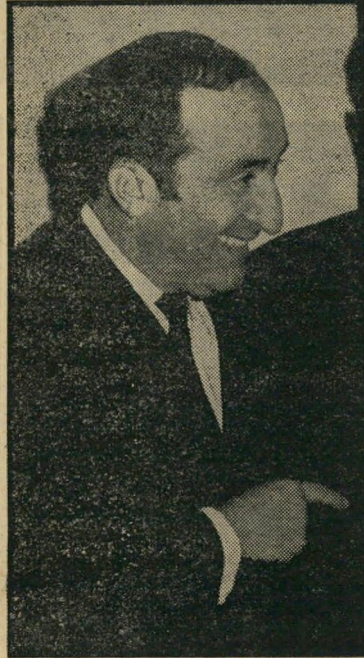
במאי גודיק "בואו ונעשה פייר-פליין"

לא, עידן המחזור הטוב לא חלף, דבר טוב קונים תמיד אם הוא באמת טוב. בחדר