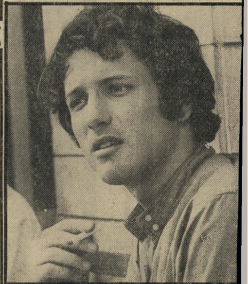
שחקן מופיקזמר דיין היכן החצי?

בכתובי הסיפור השתתף גם ניסים עזיק' רי, שחקן הבימה - שגם יופיע לצידו של אסי בסרט. אם ימצא החצי האבוד או לאו