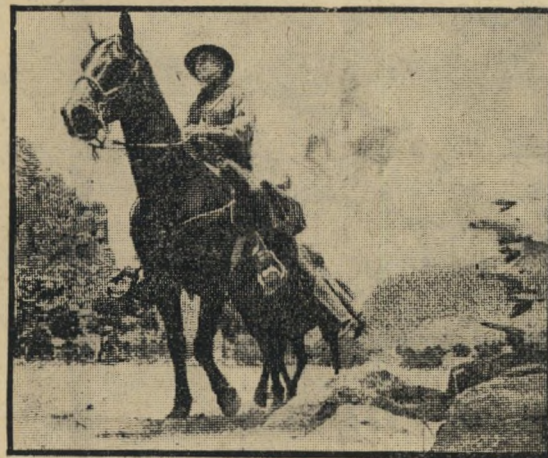
לנקסטר: שוטר הוא רוצח בשכר

לעומת המישור האידיאולוגי, שאינו תמיד משכנע, הרי הופעתם של בורט לאנקסטר (איש החוק הקשוח), רוברט ריאן (שריף עיף מלחמות) ולי ג'י. קוב (בעל החוות) משכנעת בהחלט. קרבות האקדוחים מרתקים, והסרט מס'