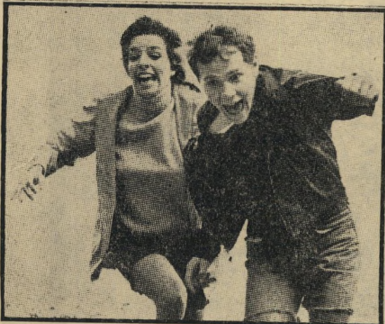
מינלי וברטון: רק 100 ק"מ

אין ספק שחלק גדול מן ההצלחה של הסרט יזקף ל' זכותה של ליוה מינלי (בתם של ג'ודי גארלנד והבמאי