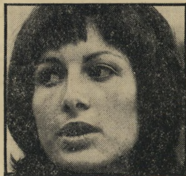
שחקנית ישי בכי היסטור

לא עניתי, כי לא סברתי שזה ענייני. לא חר מכן ראיתי על כתפיו את הדרגות, אולם הוא לא חשב כובע משמרה ותלבוש. תו היתה מרושלת. אמרתי שמתלאביב.