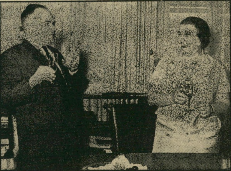
גולדה מאיר משיקה כוסות עם מיכאל בודרוב, אז שגריר ברית המועצות בישראל, כשיחסי שתי המדינות נראו שפירים ונורמאליים, בעקבות רוח שאשקנס. האם תחזור תקופה זו שנית?

את ביקורו של לואיס בישראל אירגן מנגנון מסויים, שאם להצמיד לו ישראל, המשמש גם ככתב של עיתון זר בישראל. הסיבה לכך היא מיסתורית.