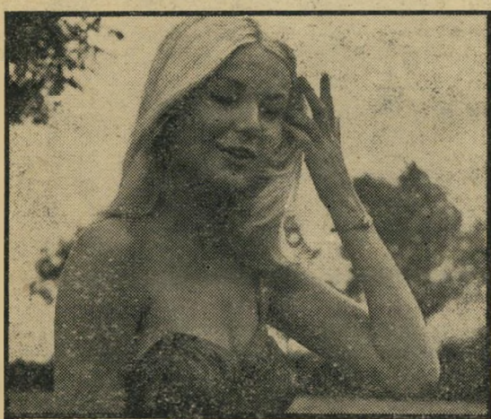
אזהרה, לא ביקורת!

אמנם, אין זה צודק לשפוט סרט לפי סריות שנותרו ממנו, אבל מצד שני, קשה שלא להסכים לדעתו של אחד