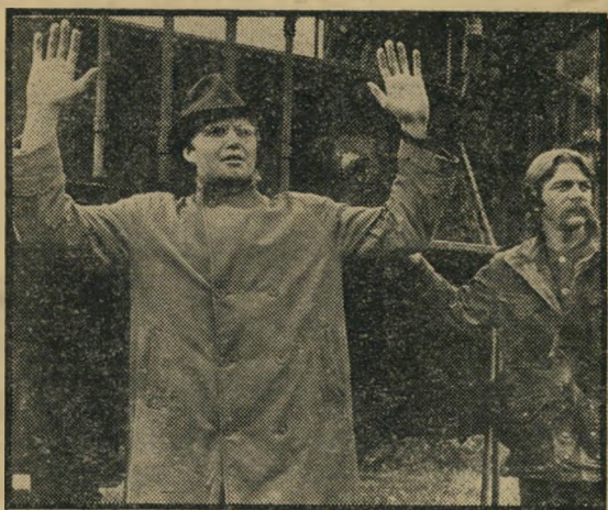
ג'ון וייט: מקאובי למהפכן

*** הקיץ שחלק (זמיר, ארצות-הברית) — התבררם של ארבעה צעירים, בחופשת קיץ על חוף הים. רגיש ומשוחק היטב. הבמאי: פרנק פרי.